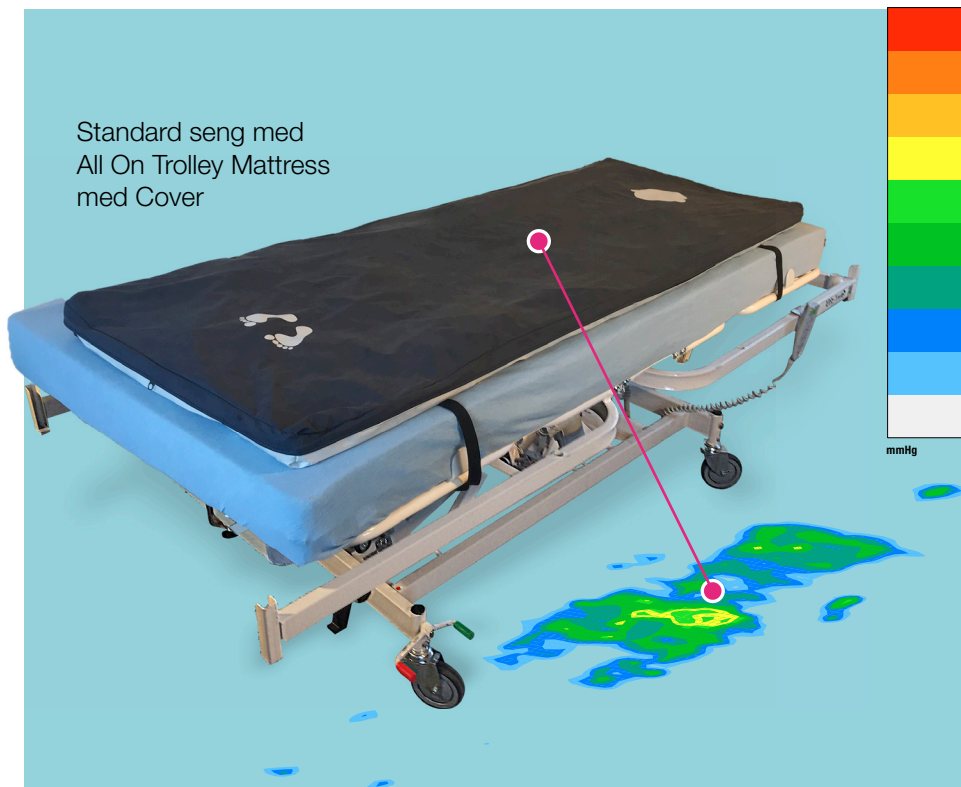
Standard seng med All On Trolley Mattress med Cover